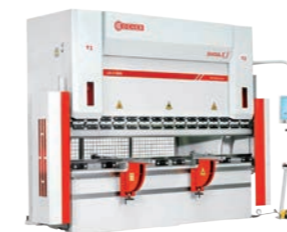
DENER PUMA XL 3100/220 4-Achsen CNC Abkantpresse

26.-29. Jan 2016 in Halle A4 / Stand A4.423