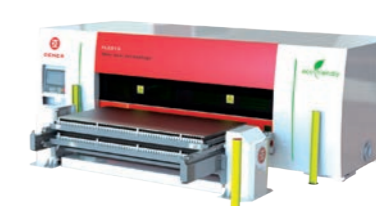
DENER Fiber Laser FL 3015 Laserschneidmaschine