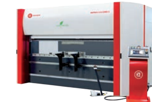
DENER SERVOBRAKE 100/30 6-Achsen Elektrische Abkantpresse