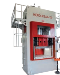
HIDROLIKSAN H 200 Ton Hydr. Doppelständerpresse