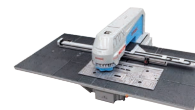
EUROMAC MTX FLEX 6 CNC Stanzmaschine