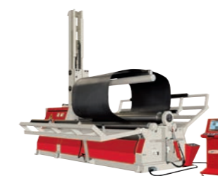
AKYAPAK AHS 30/13 4-Walzen Rundbiegemaschine