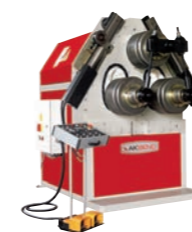
AKYAPAK APK 101 3-Walzen Rohr- & Profielbiegemaschine