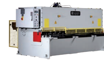
DENER NC 30/10 NC Hydraulische Tafelschere